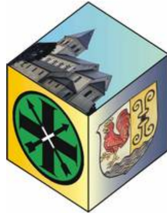
St. Sebastianus Bruderschaft Wittlaer 1431 e.V.